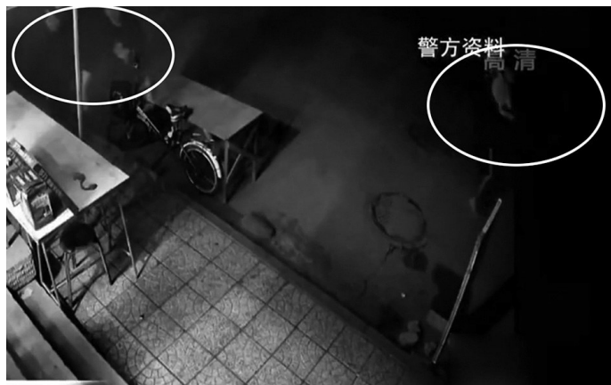
犯罪嫌疑人一直尾随两名学生。