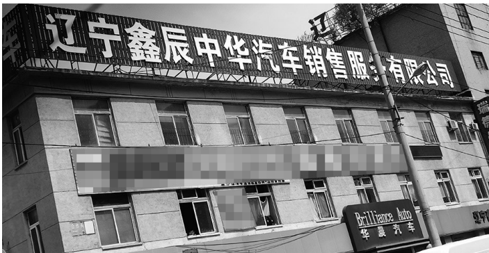
崔先生在辽宁鑫辰中华汽车销售服务有限公司参加一个优惠活动,到期后交的1000元还没有返还。