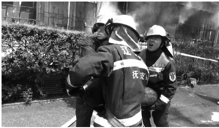
消防员将气瓶从火场抱到安全地带并稀释降温。