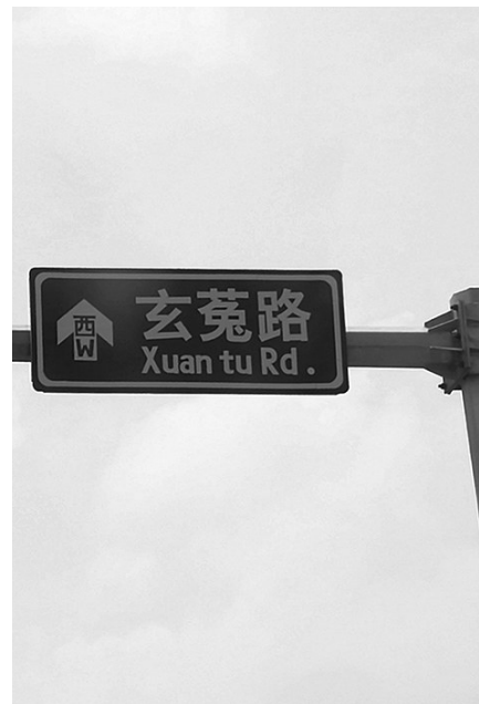
沈抚新区内的玄菟路路牌。

那么，上伯官屯古城是否具有玄菟郡的治所特征呢？20世纪80年代，王绵厚曾先后五次亲临此地，观其城址坐落在今沈阳城东20公里的上伯官屯的村庄内，傍临浑河支流牯牛河西岸台地。城址呈长方形，南北略长于东西，现存城墙的北侧和东侧大部分被河水冲去，仅存南侧城墙326米、西侧城墙537米，其规模大于汉魏时期的一般县城。早年调查时，城内尚存十字大街，其东西横向大街，即为明清时期的由盛京（今沈阳）通往抚顺关和兴京（新宾）的“御道”。后经沈阳考古工作者调查和测试，发现该城址地下文化层约1.5米处，出