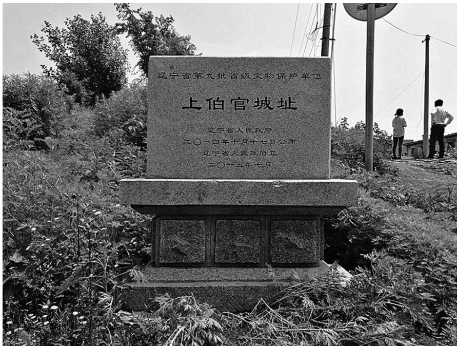
位于今沈抚新区内的上伯官屯古城文保提示碑。

这一历史事件，在史书中有明确记载。《汉书·地理志》记载：“玄菟郡，武帝元封四年（公元前107年）开”；《汉书·武帝本纪》记载，元封三年（公元前108年），“朝鲜斩其王右渠降，以其地为乐浪、临屯、玄菟、真番郡”；《三国志》卷30《东沃沮传》记载：“汉武帝元封二年（公元前109年），伐朝鲜，杀（卫）满孙右渠，分其地为四郡，以沃沮城为