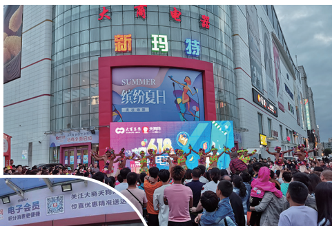
于洪新玛特异域风情十足的表演嗨翻全场