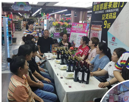
中街新玛特举办大商全球稀缺商品品鉴会,备受消费者好评