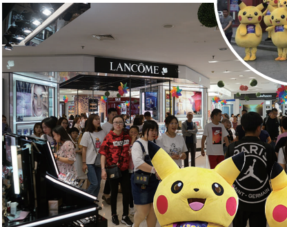
中街新玛特美妆品类日活动销售火爆