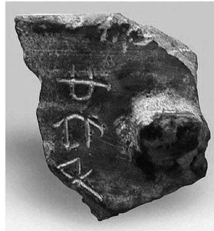
▲青桩子城址出土的秦始皇“廿六年”陶量残件。