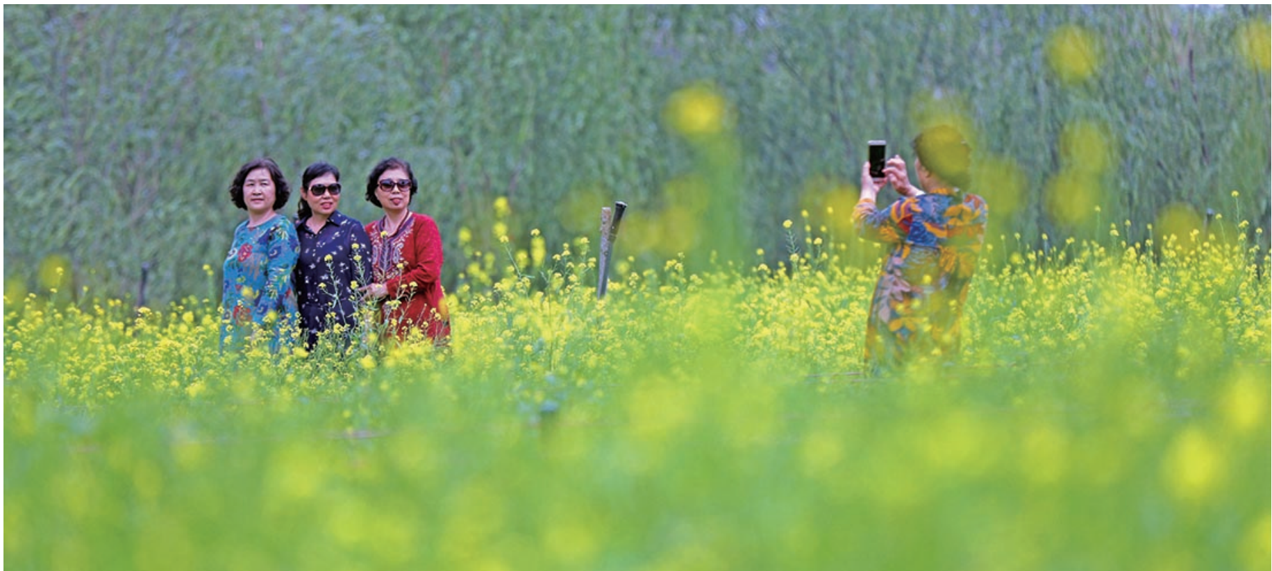
6月3日,辽宁省沈阳市长白岛森林公园里市民在油菜花丛中拍照留念。