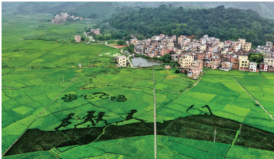
6月2日,在广东省肇庆市无人机拍摄的“童心飞扬”稻田画。