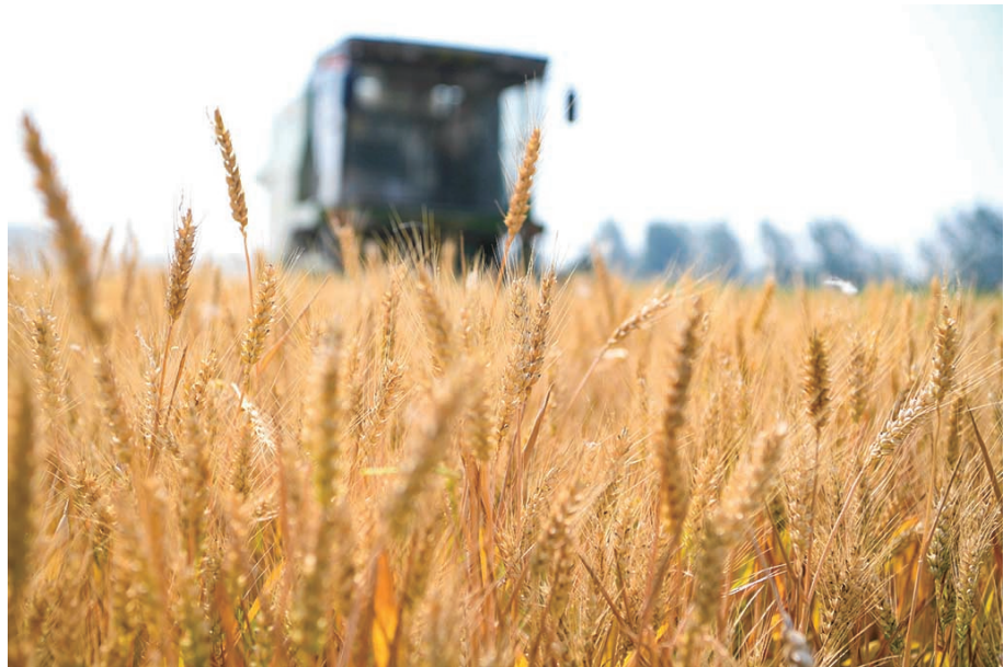
6月2日,在安徽省亳州市谯城区赵桥乡赵桥村,村民在田间收割小麦。

一棵棵绿绿的油菜细长而又挺拔,在微风中轻轻地摇曳。沈阳市长白岛森林公园里的油菜花已全面进入了盛花期,在蓝天白云下金黄的油菜花像极了一幅散着金光的“卷轴画”。大片大片金黄色的麦子,在风儿的浮动下涌过来阵阵麦浪,黄灿灿的,多耀眼呀!一块块稻田,稻浪绵延、大地锦画,这栩栩如生的稻田画吸引了众多游人前来游览。夏日,景色如画。