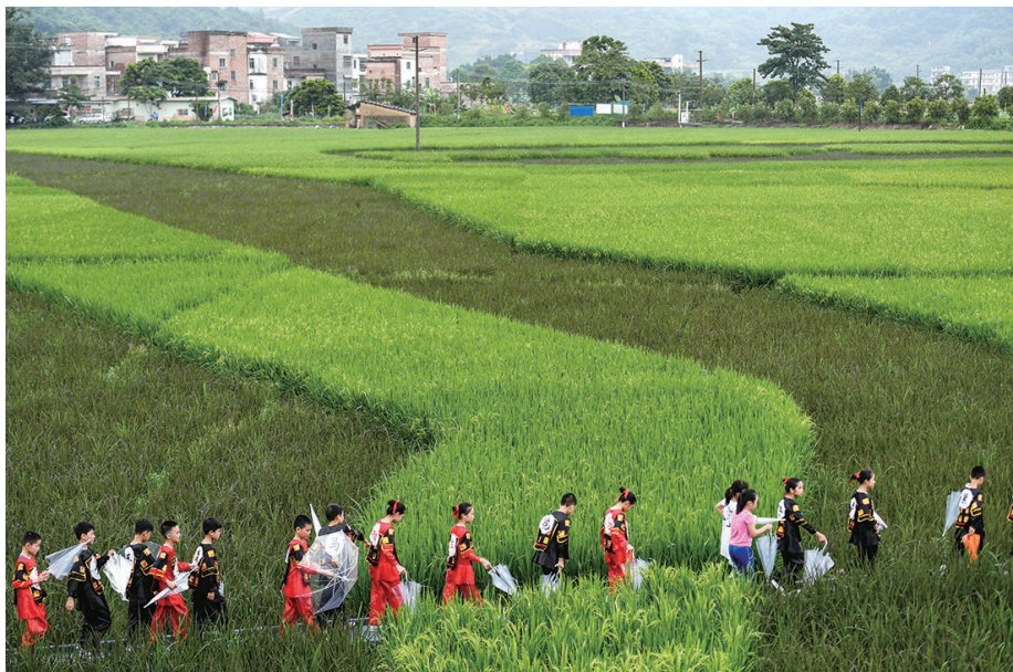
6月2日,一群小朋友在广东省肇庆市罗洪村参观稻田画。