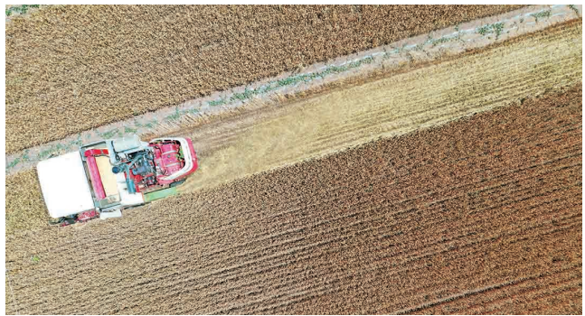
6月2日,在安徽省亳州市谯城区十河镇褚刘村,村民在田间抢收小麦。