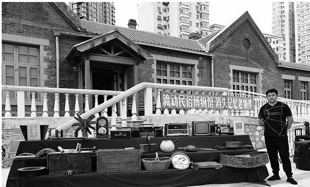
刘国壮与他收藏的老物件。

随着老物件收集活动的不断开展，理解、支持刘国壮的人越来越多。一次，刘国壮去昌图约见一个收老物件的贩子，他是当地农民，业余时间下乡骑摩托车挨家挨户收集老物件，收到合适的就在网上卖，挣点辛苦钱。到达昌图后，那人得知，刘国壮是做公益讲座的，很受感动，说：“联系我的都是二道贩子，专门做公益活动的，你是第一人！见面是缘分，这样，我送你两个老物件吧：一个是木质文具盒，一个是老单腿驴，咱