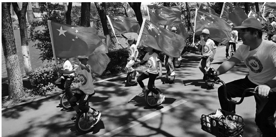
浑南九小560名学生在浑河南岸骑独轮车10公里。