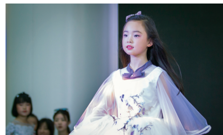
只要登上大赛的舞台,每位童模的脸上都会写满自信。

沈阳市铁西区春晖学校 华文艺术教育 酷乐豪斯国际少儿创意美术教育机构 普菁教育 盛京金声艺术培训 硕果幼儿园 小吉姆国际双语幼儿园 斯波克幼儿园 智慧宝宝幼儿园 爱贝乐培训学校 辽沈晚报童模大赛持续火热报名中。