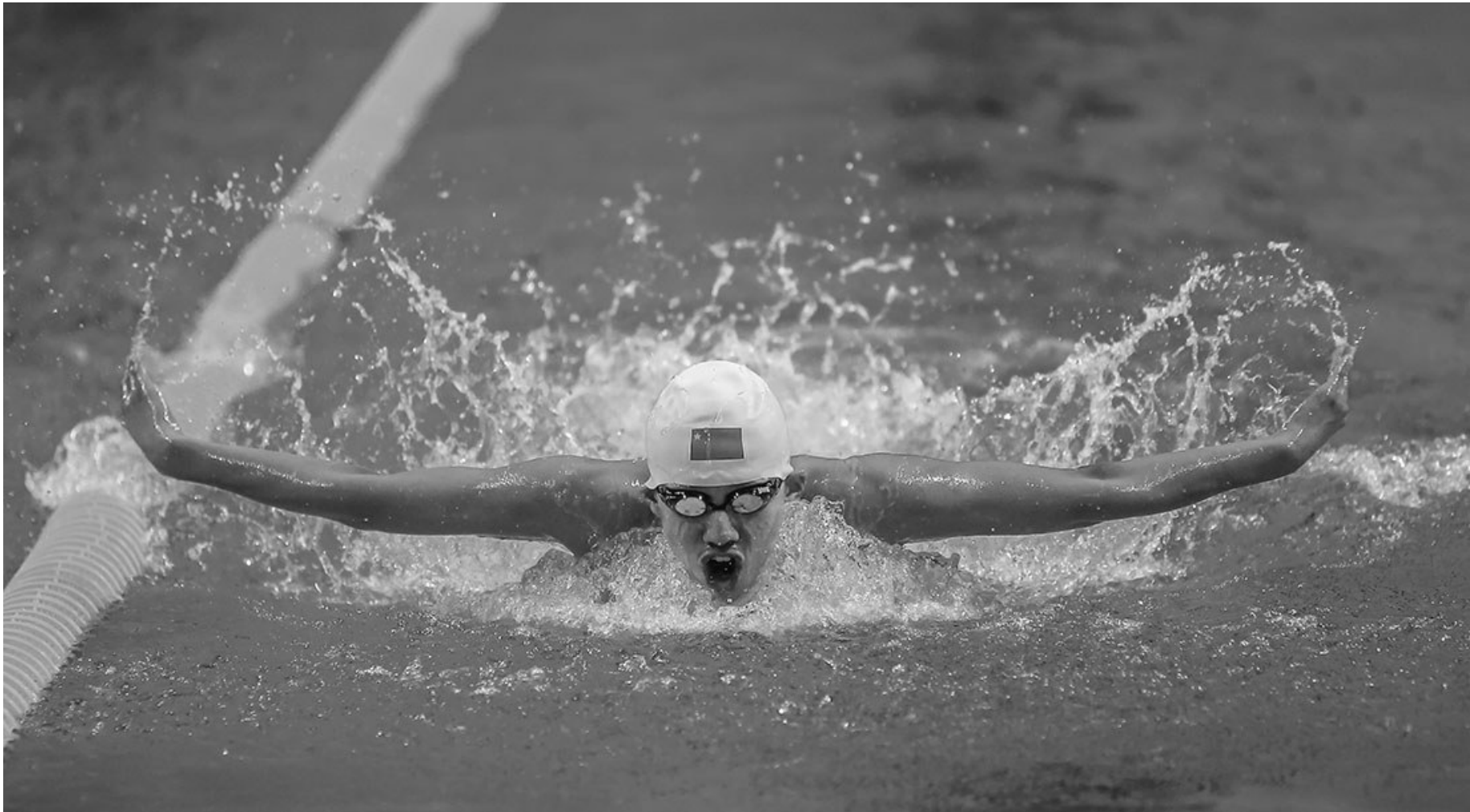
选手在蝶泳比赛中劈波斩浪。