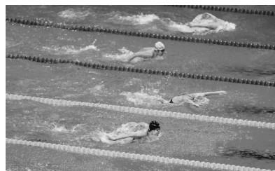
在5月8日晚举行的女子乙组200米蝶泳决赛B组比赛中，选手激烈角逐。