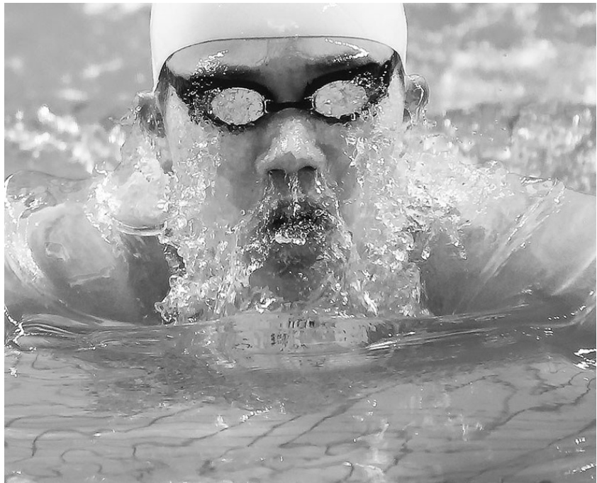
选手从泳池中探出头的一刻，脸上挂出一层水花。