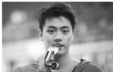
一位获得第一名的选手“咬奖牌”庆祝。