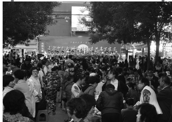
多福社区百家团聚迎中秋。