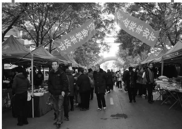
多福社区举办丰收节。