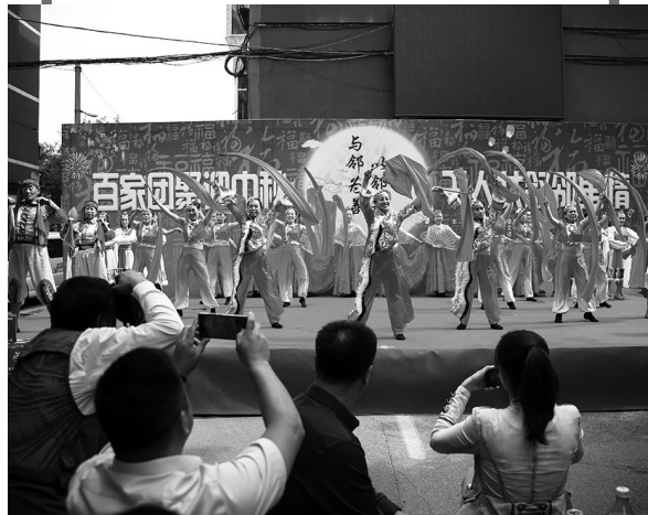
多福社区百家团聚迎中秋。多福社区供图