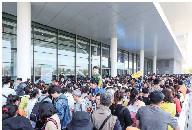
5月3日,来辽宁省科技馆参观的游人众多,大家通过隔离护栏蛇形前进入馆参观。