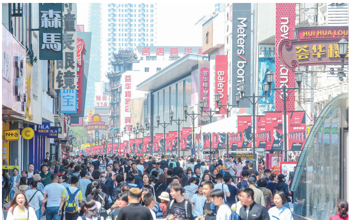
假期里的沈阳中街步行街,人山人海。