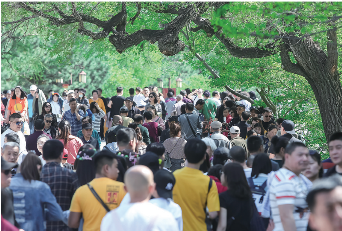
5月2日,大批游客来到北陵公园参观游玩。