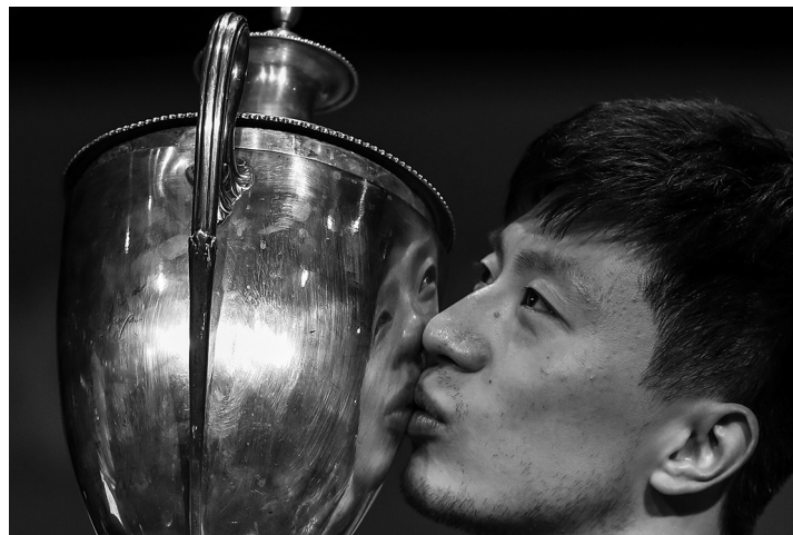
马龙勇夺世乒赛男单三连冠。