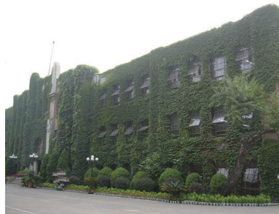
同泽女子中学旧址。