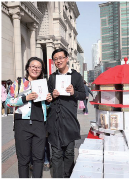
22日，《盛京皇城》新书发布会现场。