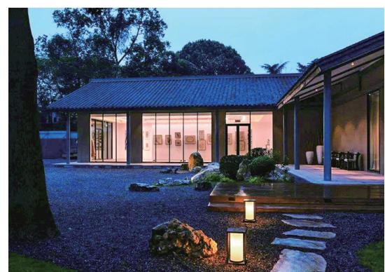
帅府后巷传统民居效果图。