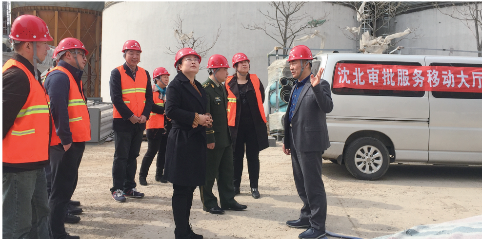
近年来,沈北新区推出多项便民利企举措,提高政务服务效率。

在项目建设“加速度”的背后,是沈北新区营商环境的不断优化。一支由1110名干部组成的服务专员队伍在沈北新区已迅速行动,为全区1110家民营实体项目和企业,提供“一对一”服务。其中,12家支柱企业和部分重点企业由区领导牵头挂钩,67个重点项目全部由区领导和部门、