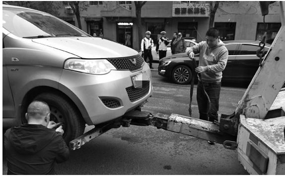
昨日上午,沈城交警部门对北文萃路上的违停车辆进行了大规模清理。

本报讯 辽沈晚报、聊沈客户端记者向前报道 起二排违停、占用消防通道停车、在停车场入口停车……沈阳市全面开展违法停车整治行动,这些违停行为将会被依法处理,严重违停的车辆将被拖移。 昨日9时50分许,沈阳市沈河区北文萃路,一辆车牌号为辽AR**E9的车斜着停在路边,两个后轮在停车位里,两个前轮出了停车位。一辆车牌号为辽A9**93的车停在了停车场的入口处,紧贴着隔离石墩。一辆车牌号为吉C0**89的车停在小