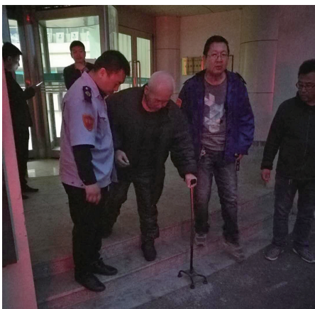
公交司机搀扶患者上车。