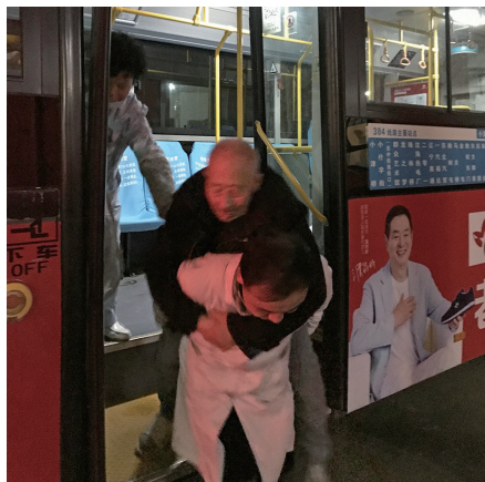
医护人员从384路公交车上背下患者。