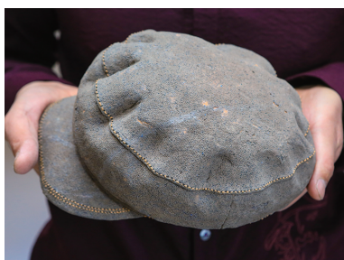
◀ 陶瓷帽子的纹理、褶皱，甚至针脚都很逼真。