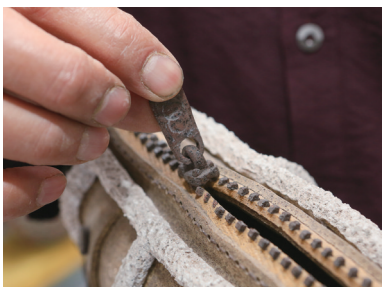
◀ 陶瓷挎包，拉链可以来回拉动。