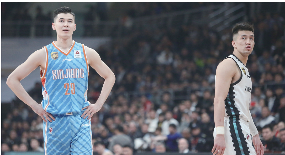
辽篮还能把比赛带回沈阳吗?

接下来,辽篮马上要迎来客场作战,其实从系列赛的晋级形势来看,已经是非常严峻的了。在今年深圳队淘汰北京队之前,无论是五局三胜还是七局四胜,都没有球队在0:2落后的情况下逆转回来。但是深圳队做到了,创造了一个历史,这也算是让辽篮依旧能够看到希望,但是从难度上说是太大了。