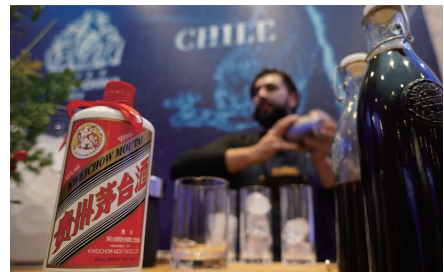
调酒师正在制作茅台鸡尾酒