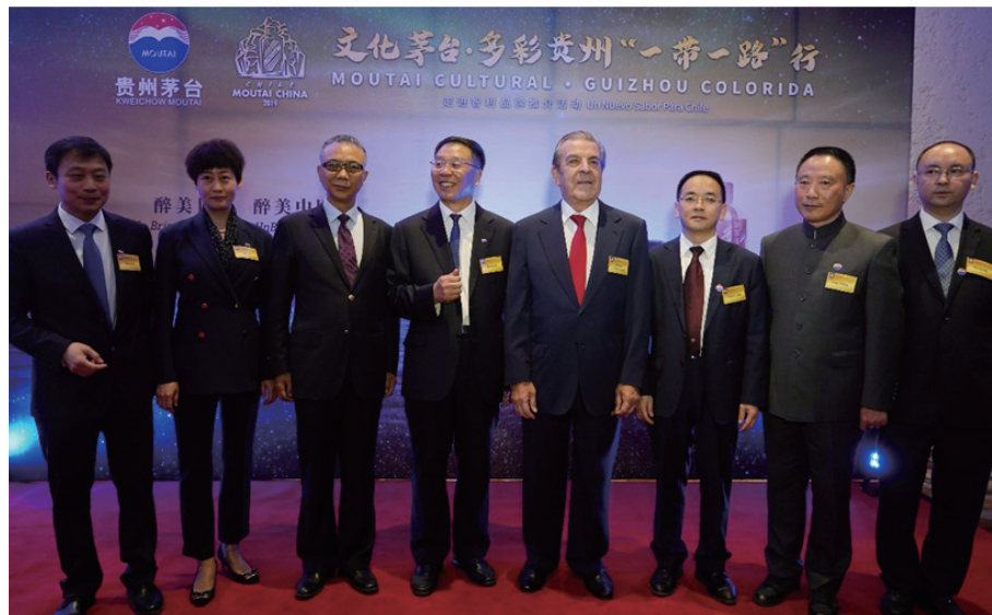
与会嘉宾共同启动推介活动

“茅台此番来到智利，既是友情的传播，更是文化的朝圣。”李保芳说，包括智利在内的拉丁美洲，不仅有着令人称道的酿酒传统，更有着影响全球的文化积淀。“我们这一代中国人熟悉的国际作家，有很多来自拉美。”