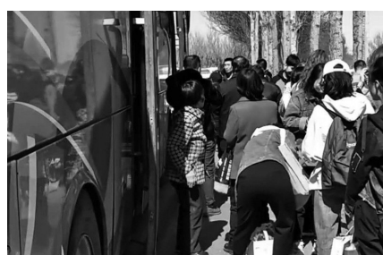
核载45人的大客车,实际拉了83人,超员38人。视频截图

“我们离客车还有100米左右,大客车司机看见交警过来检查,往后倒车想调头,但路上的车非常多,客车倒了有五六米就被我们拦停了。”徐洋介绍:民警靠近车辆,发现司机已经没影了,乘客从车上下下来很多,“我们清点人数、现场核实,该车辆行驶证规定核载45人,车辆实载83人,超载38人,超员的乘客都是站在车里的。”