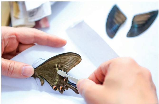
摘翅时先取下翅,后取上翅。