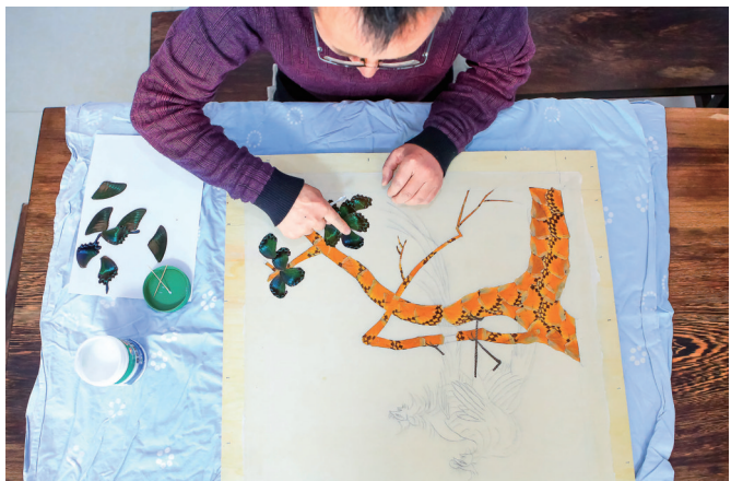
蝶翅画多达三十多道工序,不但要求创作者技术娴熟,还要有充分的耐心。