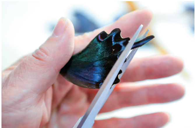
剪翅时,左手虎口虚夹住蝶翅,用的是个巧劲儿,力量过大,会损坏表面的绒毛和色泽。