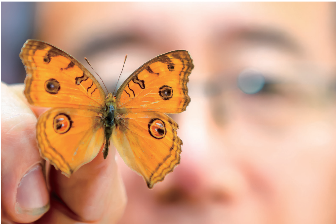
这种被称为“眼蝶”的蝴蝶翅膀上有类似眼睛的图案,是蝶翅画中制作眼睛的不二之选。