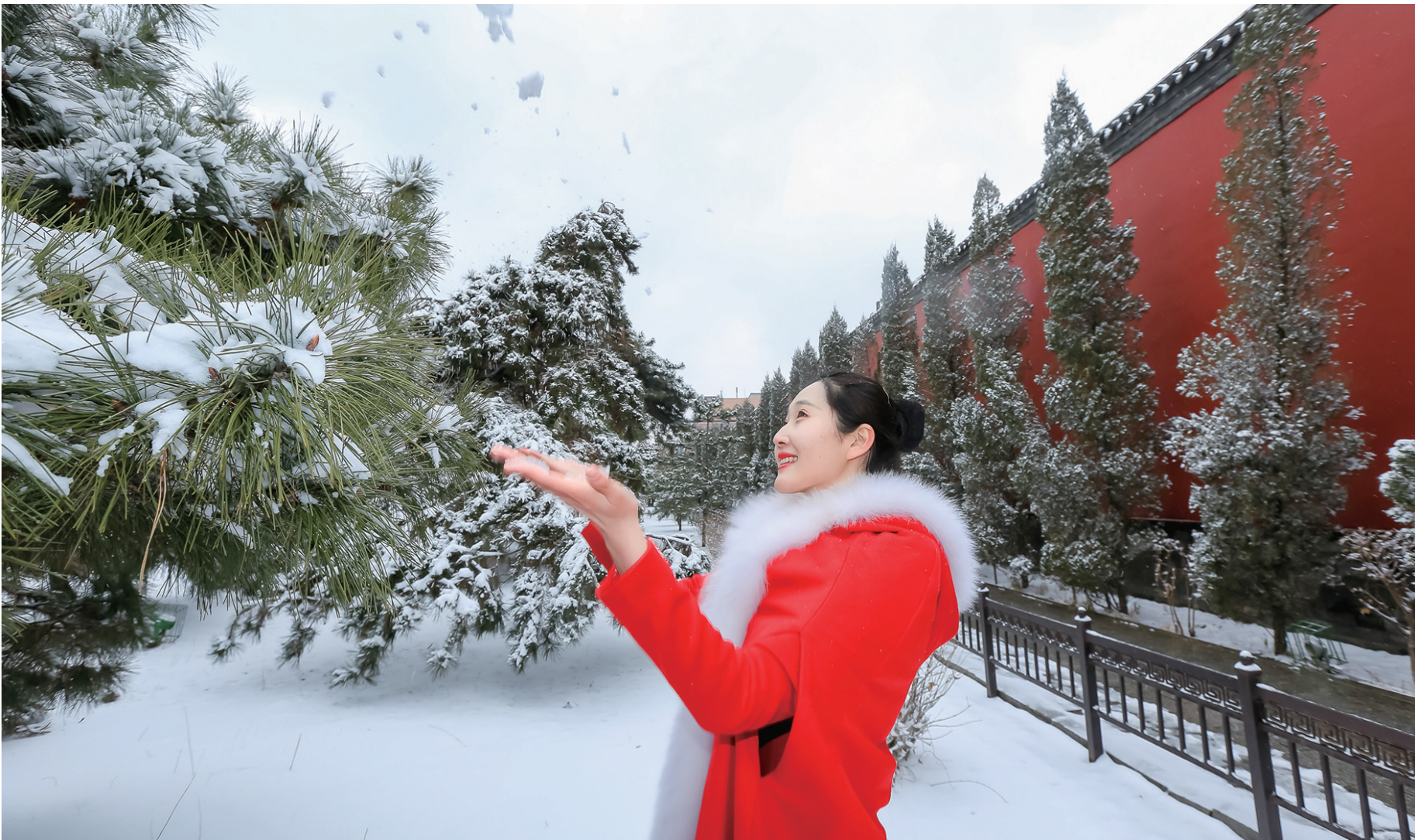
昨日,春分迎春雪。沈阳故宫的红墙与白雪交相映衬。