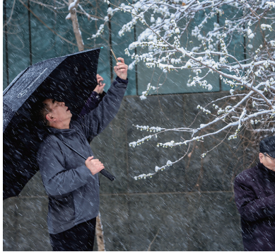
飞雪伴桃花,市民争相拍摄。