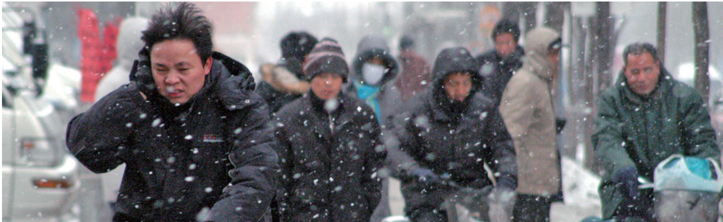
突变的天气,让人们把刚脱下的冬装翻出来又穿上了。