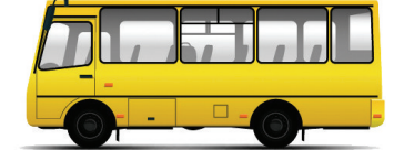
辽沈晚报、聊沈客户端记者 张阿春

推广清洁能源汽车,全面整治“冒黑烟车”。到2020年,辽宁各市主城区城市公交车和出租车力争全部更新(改造)为清洁能源或新能源汽车。