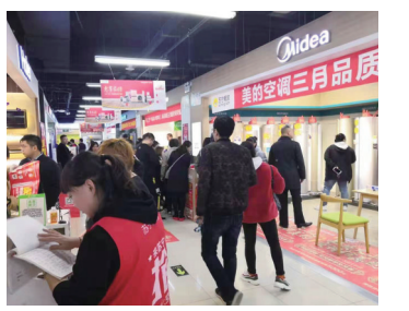
沈阳苏宁全民焕新节销售现场火爆

记者了解到,苏宁易购以旧换新补贴将达10亿。对有意向以旧换新的用户,实行先补贴再回收,免除后顾之忧之优。先行补贴的玩法,在业内属首创,推高行业操作水准,对消费者来说,是件大好事。先行补贴的玩法,属于家电市场