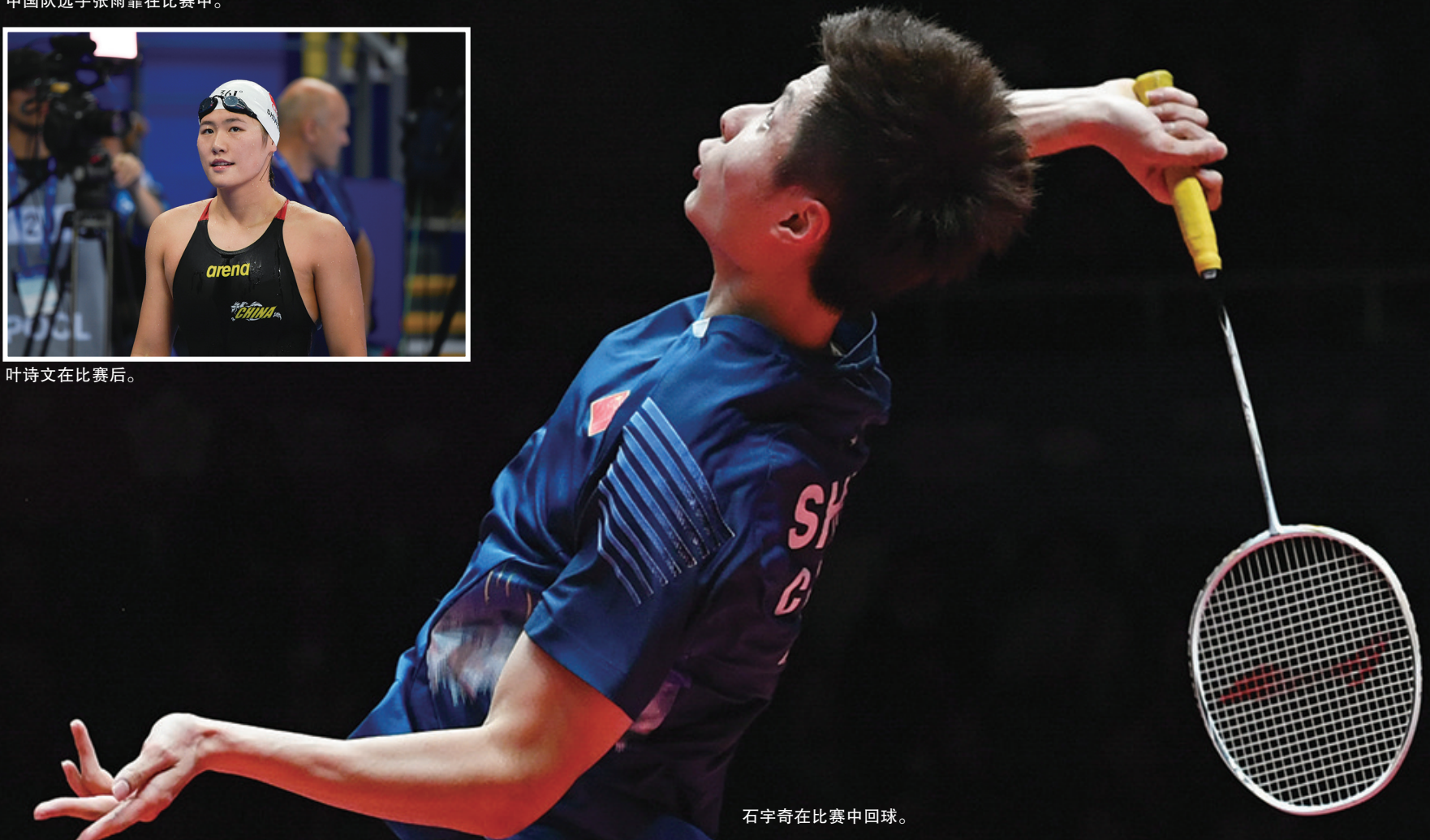
石宇奇在比赛中回球。