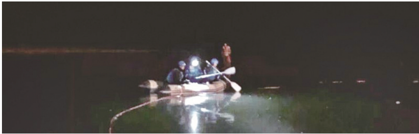
救援人员在冰面施救。

施救人员决定由3个人划船下河打捞。施救人员先把绳索系到船上,河两岸有人帮忙拽着以保证队员安全。之后队员用冰锥子扎着冰面推动小船前行,后来实在划不动了,消防人员用云梯顶住小船推着前行,之后小船才下水展开救援。“老人落水处的冰窟窿面积小,无奈我们只好顺着水流凿出了大约10米长的空