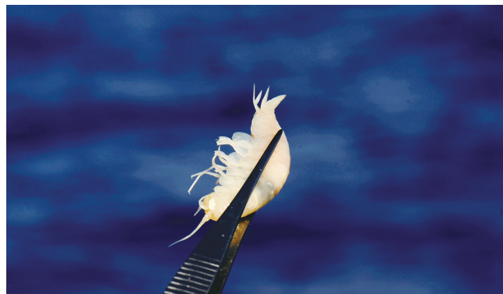
“彩虹鱼”着陆器在近6000米深的西太平洋海底捕获的钩虾(12月4日摄)

机构的60名考察队员和船员11月25日乘坐“沈括”号从上海起航,计划完成第一个深海站位海试和科考作业后,直奔马里亚纳海沟。