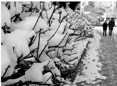
冬天来了。