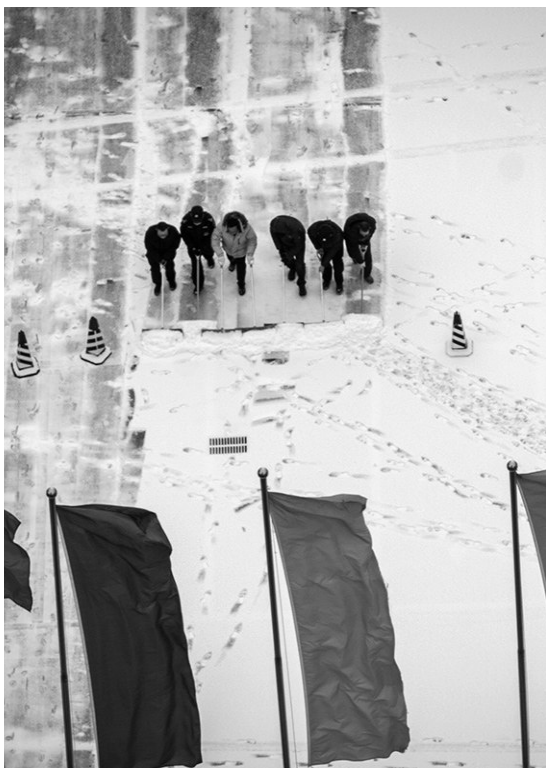
大地披上银装。