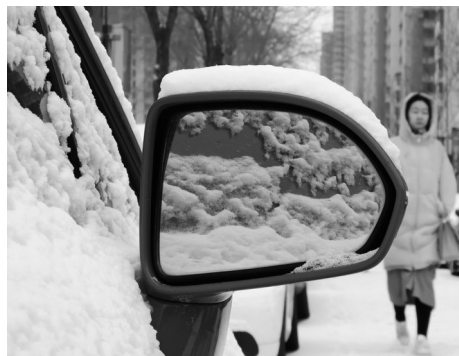
凛冬已至。