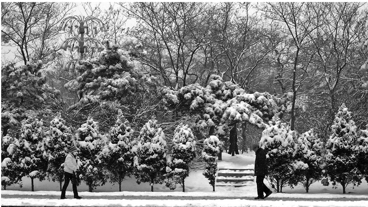
清晨，沈城大地一片银装素裹，雪景美如画卷。

本报讯 辽沈晚报、聊沈客户端记者胡婷婷报道 昨日，沈城迎来一场小雪，但并没有“雨露均沾”。南部地区雪量较大，北部的康平和法库并没有雪花。从雪量来看，大部分地区为小雪量级，苏家屯地区为小到中雪量级。 今日是“大雪”节气，早晨会迎来降温，最低温度预计为-20℃左右；白天天气晴好，最高气温只有-10℃；夜间最低气温将到-19℃附近，可以提前感受到“三九天”的寒意。 周六依然是晴冷天气，气温在-9℃到-18℃之间，早晨最低温度将达到-20~-21℃。周日气温会有小幅回升，适合外出。之后的几天气温将上下起伏，但幅度不会很大。