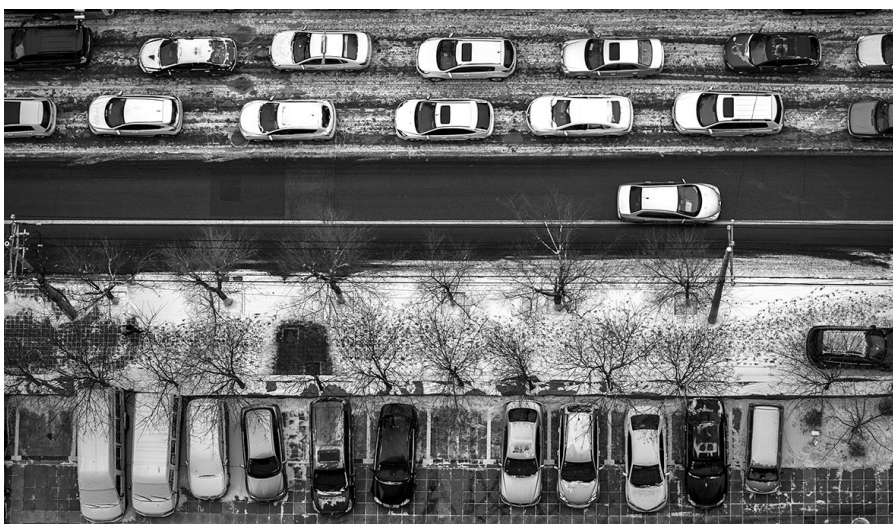
初雪过后，街边一片白色。