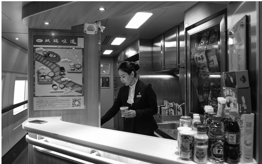
高铁列车上的餐吧。