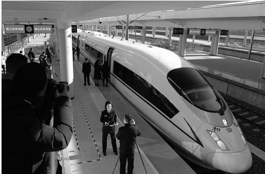
高铁列车抵达通辽站。

新通高铁开通后,在增进城市间交流与合作,加速人流、信息流、科技流快速流动的同时,也一定会推动沿线旅游业、农副业的发展,进而加快区域产业优势互补,形成产业链,从而有效促进沿线贫困县(区)的发展步伐。