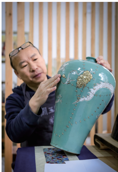
这件粉青釉梅瓶在铜补时设计了云纹，与原作非常契合。