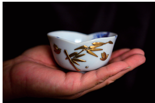
这件元宝形握杯在铜修时设计了竹与鸟的元素，与原有的梅、竹呼应，聚齐“岁寒三友”。