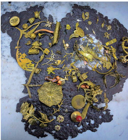
这些老铜制成的花钉每个都是独一无二的。