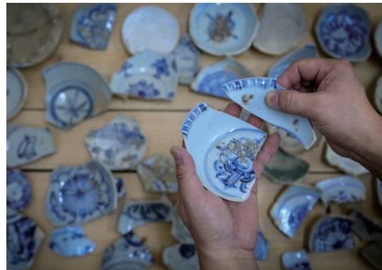
残瓷焕彩，破损的瓷器被赋予第二次生命。