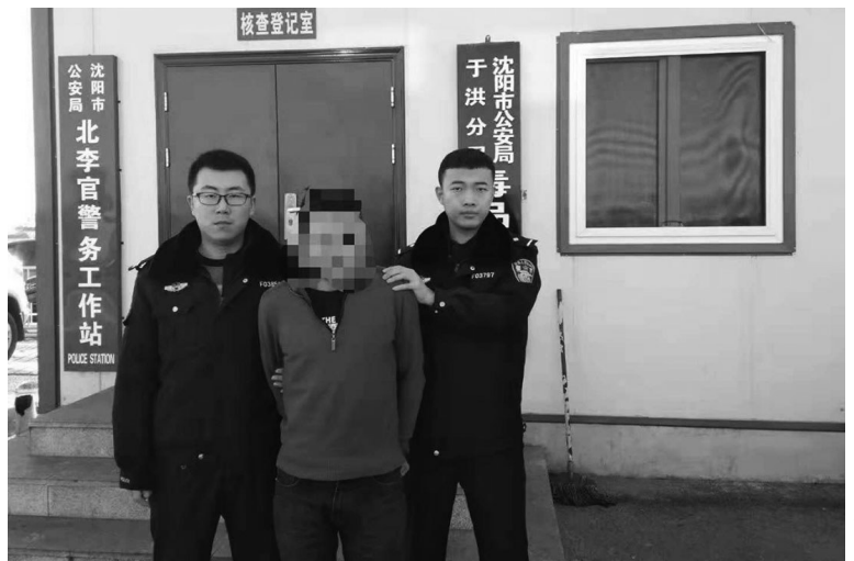
沈阳于洪警方抓获一名涉嫌强奸杀人犯罪19年的逃犯。

每年大半的时间都在想着逃亡,或在逃亡的路上,这19年从没回过家,也没探望过家人。这名19年前强奸杀人的逃犯在沈阳落网。这次来沈他本来想在这里找个生计,没想到还没下车就被警方抓获。