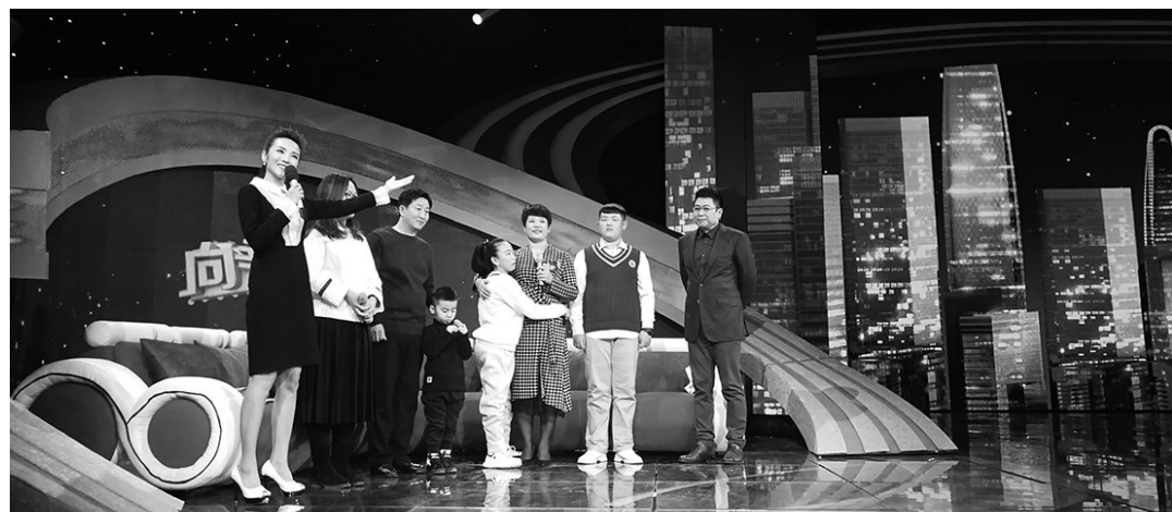
尚新与其资助者在央视《向幸福出发》节目录制现场。