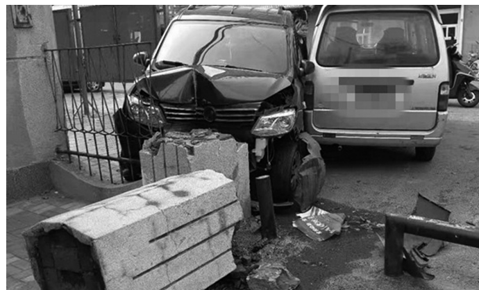
昨日中午12时许,在沈阳市铁西区保工街132号附近,一辆黑色吉普车撞断小区院门柱子。

本报讯 辽沈晚报、聊沈客户端记者靳丹报道 就是想停辆车,不成想油门当刹车,一个冲劲直接把小区门柱子撞折了,而且还把旁边停放的一个面包车刮碰。昨日中午12时许,这一幕发生在沈阳市铁西区保工街132号附近。“好在当时没人,这要是有人得多危险。”