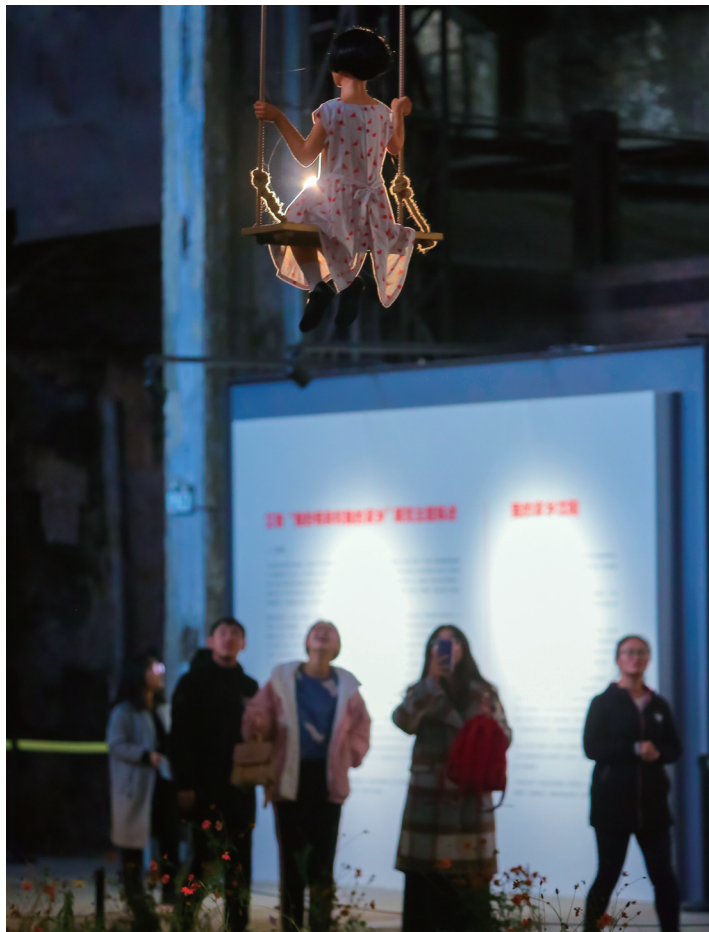
大学生被装置作品《女孩儿与秋千》所吸引。