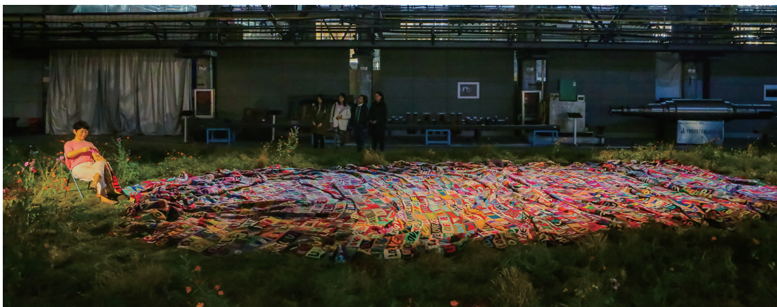
在母亲的雕像脚下,一张编织有LOVE图形的毯子蜿蜒铺展开来,像母亲编织的爱河一般绵长……