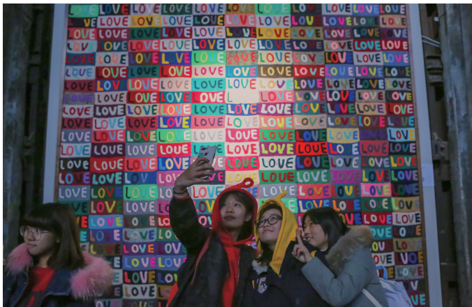
织满“LOVE”英文的毛线作品《我的母亲》深受喜爱。