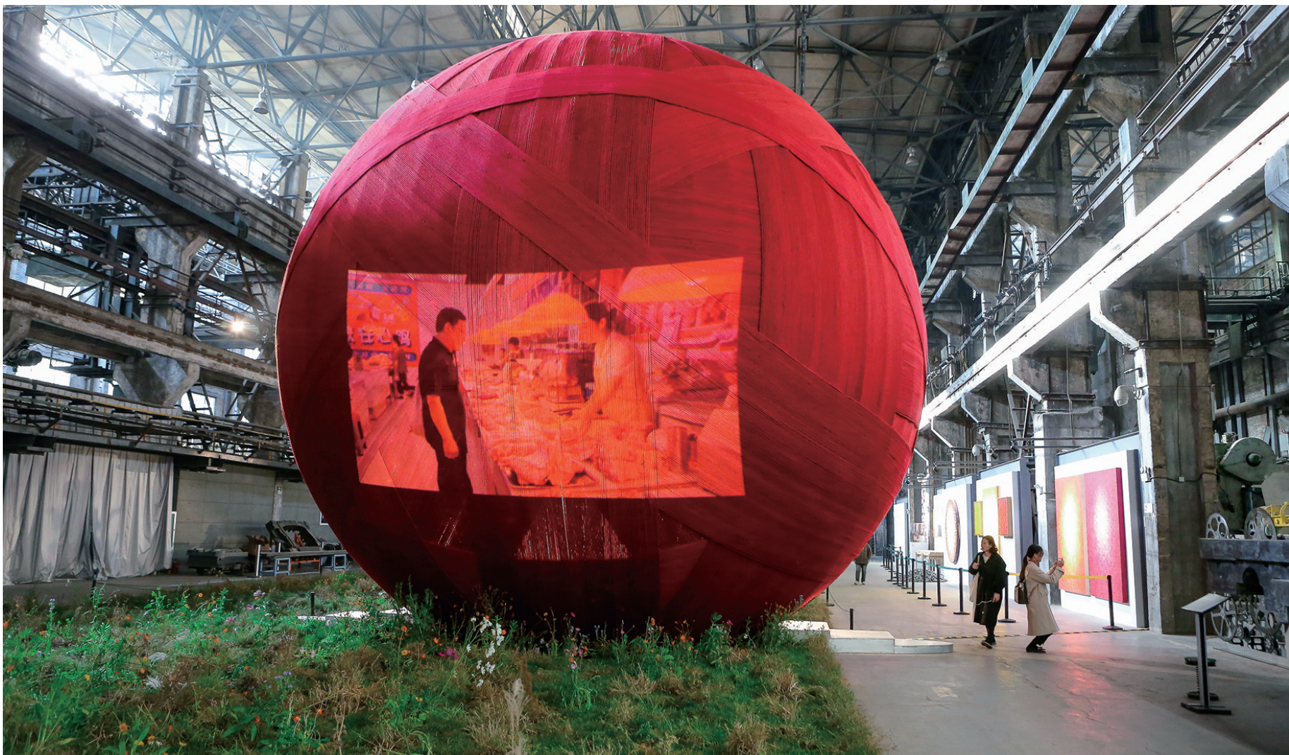
装置作品《母亲的味道》是一个直径9米的大红色的毛线球,球体顶部每隔20分钟会有气体散发出来,这是一件味觉作品,创作灵感来自于母亲用过的发油的味道。