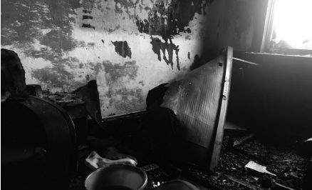
11月10日下午13时许,沈阳市皇姑区华山路37-10号楼6单元顶楼一户人家着火,卧室里原来放着的床都烧没了。