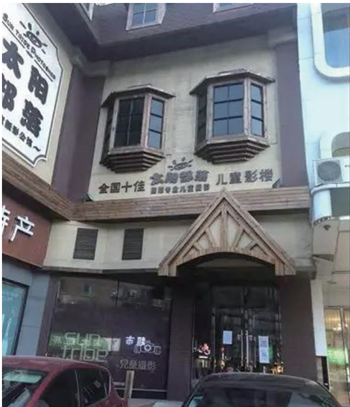
太阳部落照相馆突然闭店,几百名消费者报警。

11月8日,记者来到位于沈河区小西路的太阳部落照相馆,只见店门紧闭,玻璃门上贴着一个用白纸打印的“告示”。内容如下:敬告各位太阳部落顾客,因太阳部落老板孙某出走,拖欠员工、供应商等薪资和款项,导致店面无法经营。各位顾客所有