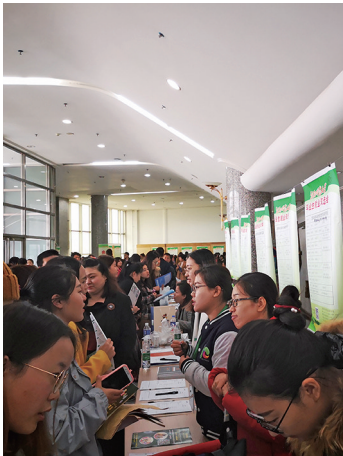
昨日,沈师大举办就业双选会。

此次招聘会涉及教育的招聘单位最多,有112家,招聘人数达4455人。在这些招聘单位中又以民办教育机构为主体,主要招聘销售人员和教师,给出的月薪在8000-15000