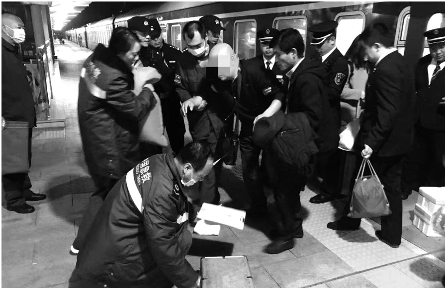
“心脏支架男”火车上突发疾病,铁警、车站工作人员联手120救助脱险。

17时31分列车准时进站,列车停稳后,列车长、列车员与病人的同行者将患者一同搀扶下车。施救人员各就各位,分别展开工作,医护人员立即上前紧急检查救治,执勤民警了解病人各方面信息,清点登记携带物品,车站工作人