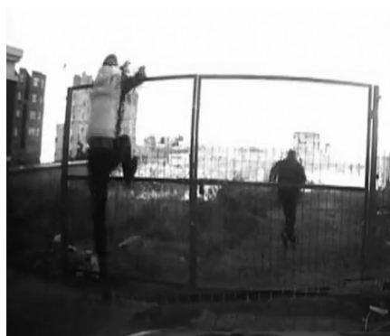
违法驾驶员弃车翻过2米来高的栅栏逃跑,交警一路追去。