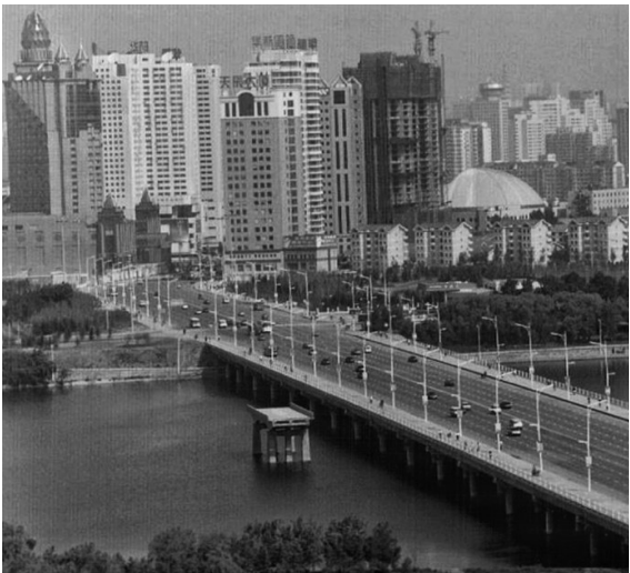
一桥飞架南北两岸。