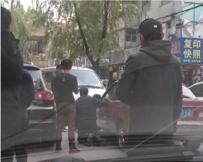
逆行面包车司机逼迫正常行驶的出租车司机下跪。 视频截图

“你给我跪下!”随着年轻力壮的男司机一声大吼,对面一名年长的出租车司机随即双腿跪地,周围市民见此情形纷纷摇头叹息:“太过分了。” 一辆逆行面包车与正常行驶的出租车“狭路相逢”,结果面包车司机暴怒,发生了以上这一幕。目前,面包车司机已经被警方控制,警方将依法对其处理。 10月27日下午2时许,朝阳市人民公园北侧一条单向南北通行的小路突然传出一阵阵争吵声,一辆由南向北逆行的面包车与相向而来正常行驶的出租车堵在了路上。 路面原本不宽,加之两旁有车辆停靠,两车错不开车,憋停在路面上,这时从面包车驾驶位下来一名年轻男子,这个人高马大的司机气势汹汹地来到出租车旁,“你给我下来!”连喊几声后,在车外伸出脚透过开着的出租车窗踹了司机一脚。 见年轻男子如此激动,年长的出租车司机随即下车劝说,但年轻男子