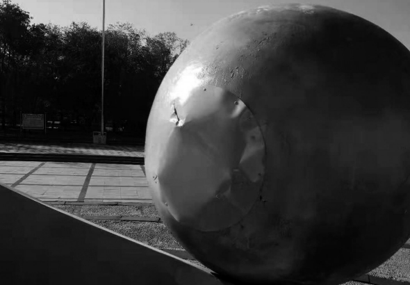
昨日，被破坏的雕塑得到修复。