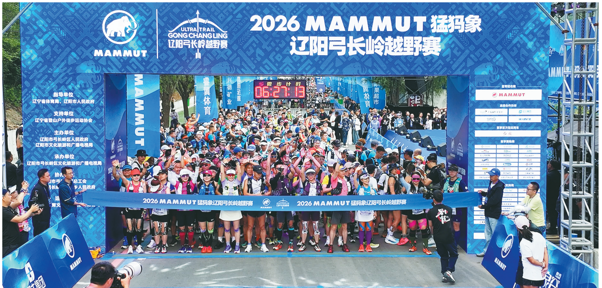
“2026 MAMMUT 猛犸象辽阳弓长岭越野赛”吸引了国内2200余名跑友参与。

对于国家全域旅游示范区的弓长岭区来说，赛事的成功举办，不仅在这里打造出了新的文旅IP，让城市更具吸引力，而且也带动了当地旅游、餐饮、住宿等产业的联动发展。尤为可贵的是，通过举办此类大型活动，凝聚了城市发展的强大合力，大大提升了市民的自豪感和幸福感。