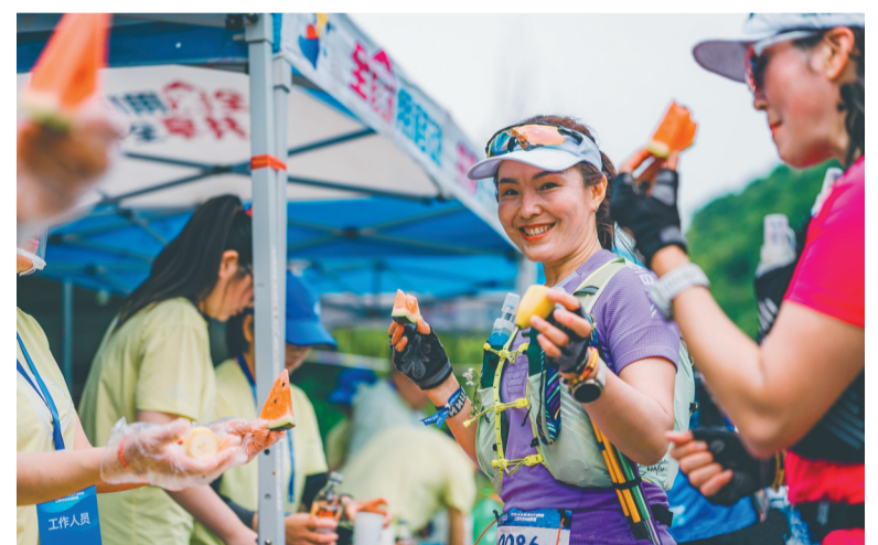
参赛选手在进行能量补给，享受美食。