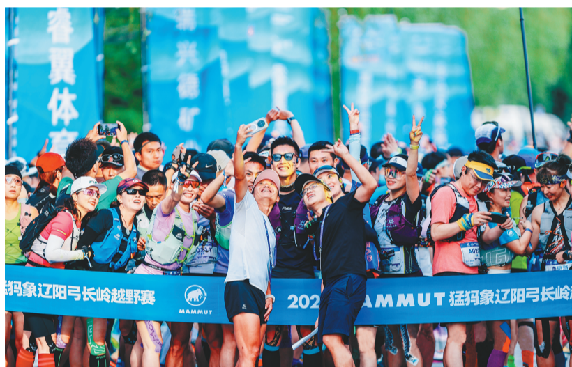
来自全国各地的跑友在赛场合影留念。

依托“中国温泉之城”“国家全域旅游示范区”资源禀赋，弓长岭区立足春花、夏越野、秋奔跑、冬冰雪四季差异化资源，深耕“体育+文旅”融合路径，系统化打造全年不间断特色赛事矩阵，用一场场精品赛事串联山水、温泉、红色、乡村资源，体育赛事已然成为展示城区形象、引流游客的全新名片。