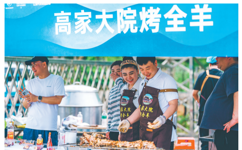
弓长岭当地有名的烤全羊成为深受参赛者喜爱的途中补给。