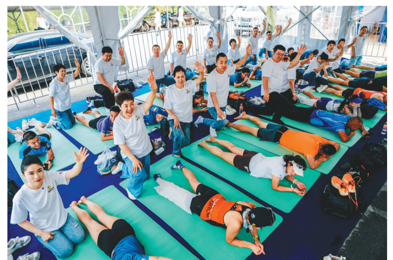
赛后，主办方安排了专业人员为选手们按摩放松。