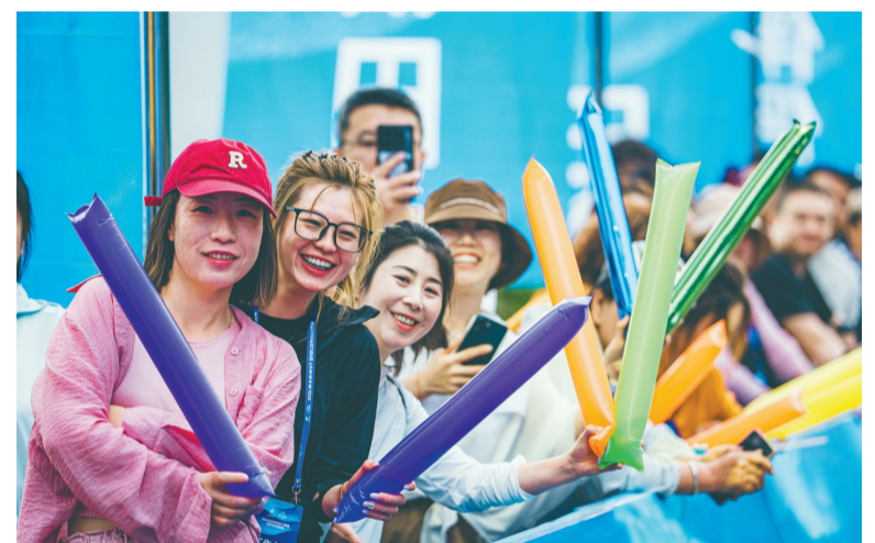
热情市民在赛道两侧为参赛选手加油。