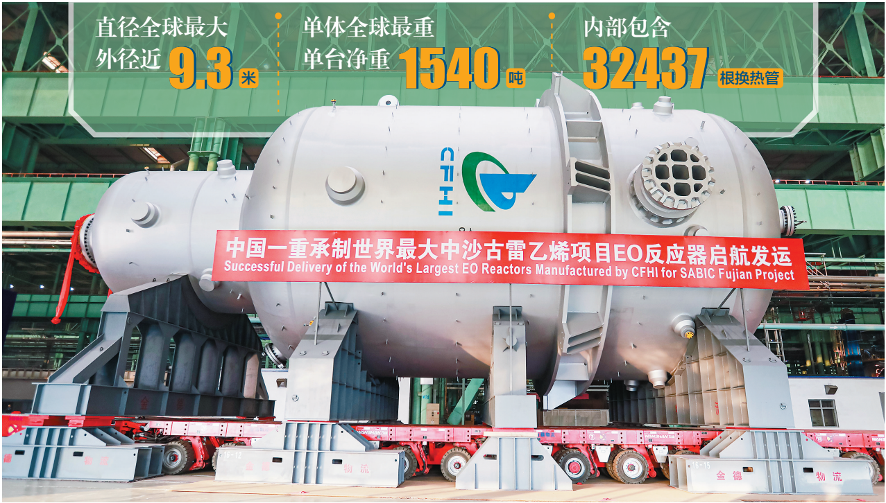
图为中国一重承制的世界最大EO反应器。

本报讯 记者王荣琦报道 外径近9.3米,单台净重达1540吨,内部包含32437根换热热管……近日,由中国一重承制的中沙古雷乙烯项目EO/EG装置EO反应器,在一重集团大连核电石化装备制造基地正式启航发运。该装备一举刷新直径最大、单体最重EO反应器的世界制造纪录,不仅彰显出中国一重的技术创新能力与制造实力,更凸显中国制造在国际重大合作项目中的核心价值。 中沙古雷乙烯项目是中国与沙特