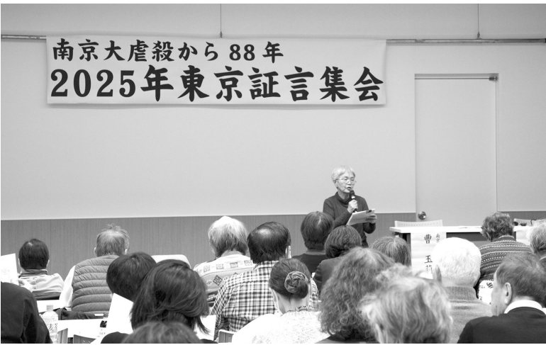
12月11日,集会主办方日本民间团体“No More南京之会”代表在东京举办的南京大屠杀证言集会上发言。