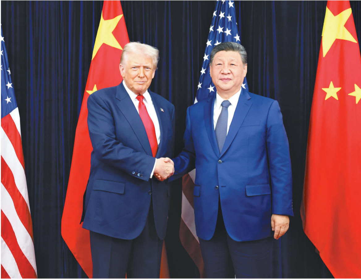
当地时间十月三十日，国家主席习近平在釜山同美国总统特朗普举行会晤。

新华社韩国釜山10月30日电（记者李忠发 郝薇薇）当地时间10月30日，国家主席习近平在釜山同美国总统特朗普举行会晤。 习近平指出，中美关系在我们共同引领下，保持总体稳定。两国做伙伴、做朋友，这是历史的启示，也是现实的需要。两国国情不同，难免会有一些分歧，作为世界前两大经济体，时而有摩擦，这很正常。面对风浪和挑战，两国元首作为掌舵人，应当把握好方向、驾驭住大局，让中美关系这艘大船平稳前行。我愿继续同特朗普总统一道，为中美关系打下一个稳固的基础，也为两国各自发展营造良好的环境。 习近平强调，中国经济发展势头不错，今年前三季度增长率达5.2%，对全球的货物贸易进出口增长4%，这是