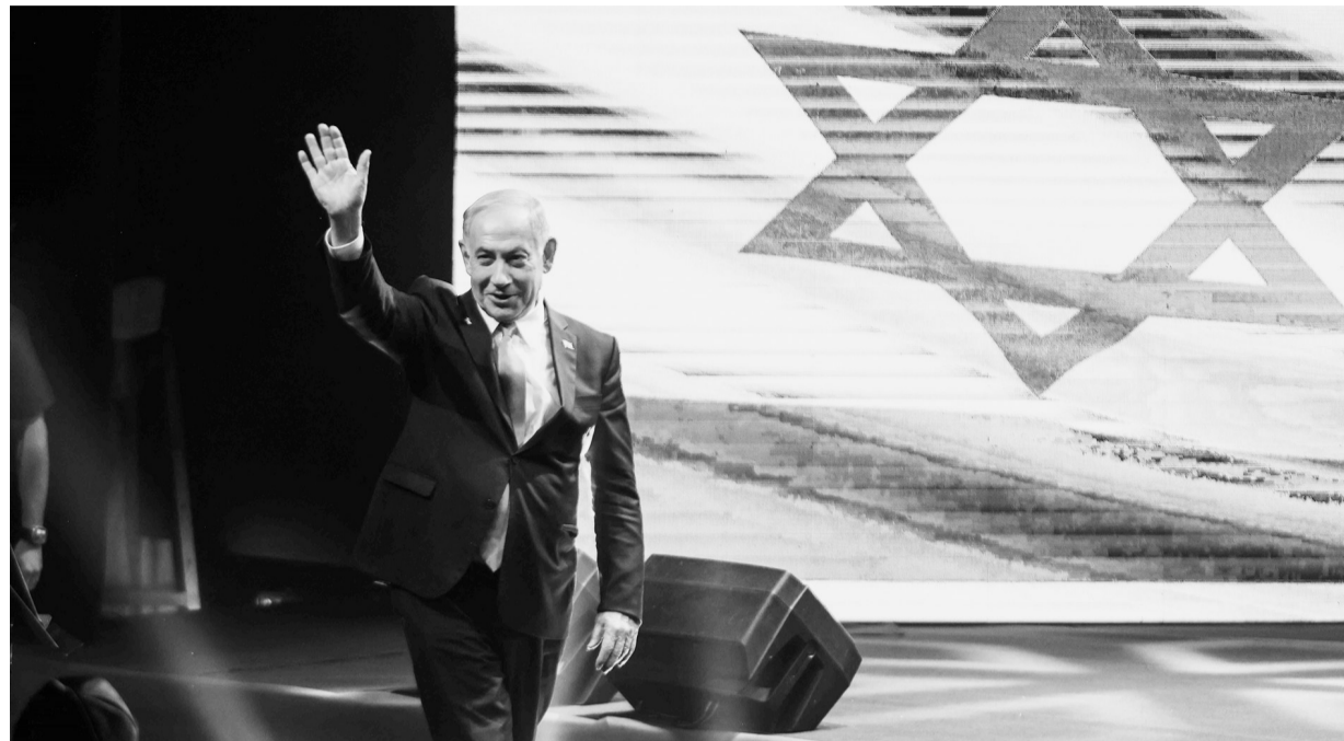
9月11日,以色列总理内塔尼亚胡在约旦河西岸犹太人定居点马阿勒阿杜明出席协议签署仪式。

以色列总理内塔尼亚胡11日签署协议,推进在约旦河西岸建设“E1区”犹太人定居点的计划并宣称“不会有巴勒斯坦国”。