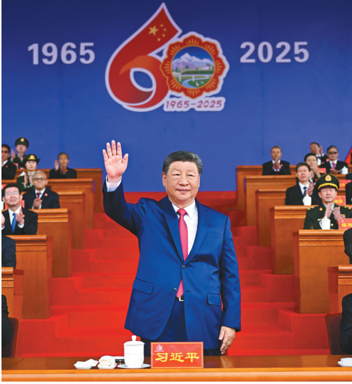
8月21日上午，中共中央总书记、国家主席、中央军委主席习近平出席庆祝大会。

贺和亲切的慰问！ 1965年西藏自治区成立，是西藏发展史上的一座丰碑，标志着民族区域自治制度在西藏正式实施，开启了西藏各民族共同团结奋斗、共同繁荣发展的时代新篇。60年来，在党中央坚强领导下，在全国人民大力支持下，西藏各族干部群众艰苦奋斗、顽强拼搏，民族区域自治制度成功实践，反分裂斗争富有成效，宗教信仰自由得到充分尊 重和保障，经济社会全面发展，人民生活极大改善，西藏的面貌、西藏各族人民的面貌发生了翻天覆地的历史性巨变。 党的十八大以来，以习近平同志为核心的党中央高度重视西藏发展、十分关心西藏各族人民，确立新时代党的治藏方略，推动西藏各项事业取得全方位进步、历史性成就，中国式现代化在世界屋脊不断创造新的奇迹。（下转第三版）