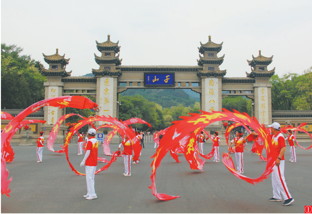
图①:端午节假期,鞍山市千山景区精心策划系列文化活动,让游客在欣赏秀丽自然风光的同时享受别具一格的端午文旅盛宴。