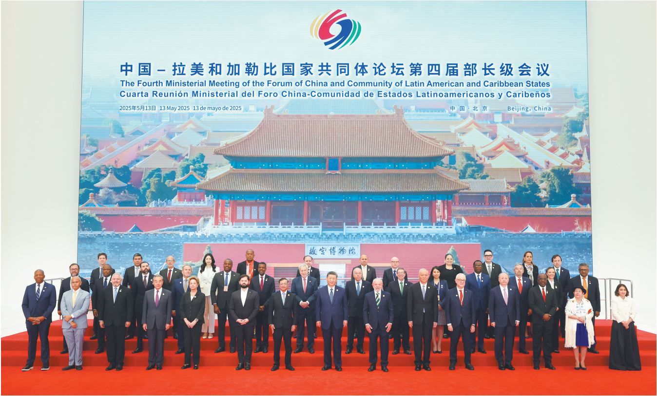
5月13日上午,国家主席习近平在北京国家会议中心出席中国—拉美和加勒比国家共同体论坛第四届部长级会议开幕式并发表主旨讲话。这是习近平与会嘉宾集体合影。

新华社北京5月13日电 （记者马卓言 冯歆然）5月13日上午,国家主席习近平在国家会议中心出席中国—拉美和加勒比国家共同体论坛第四届部长级会议开幕式并发表主旨讲话。习近平宣布,中方同拉方携手启动五大工程,共谋发展振