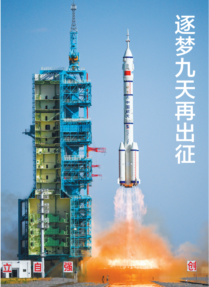
4月24日,搭载神舟二十号载人飞船的长征二号F遥二十运载火箭在酒泉卫星发射中心发射。

变幻,中国真实诚挚对非政策理念不会变,中非患难与共、守望相助的初心不会变。(下转第二版)