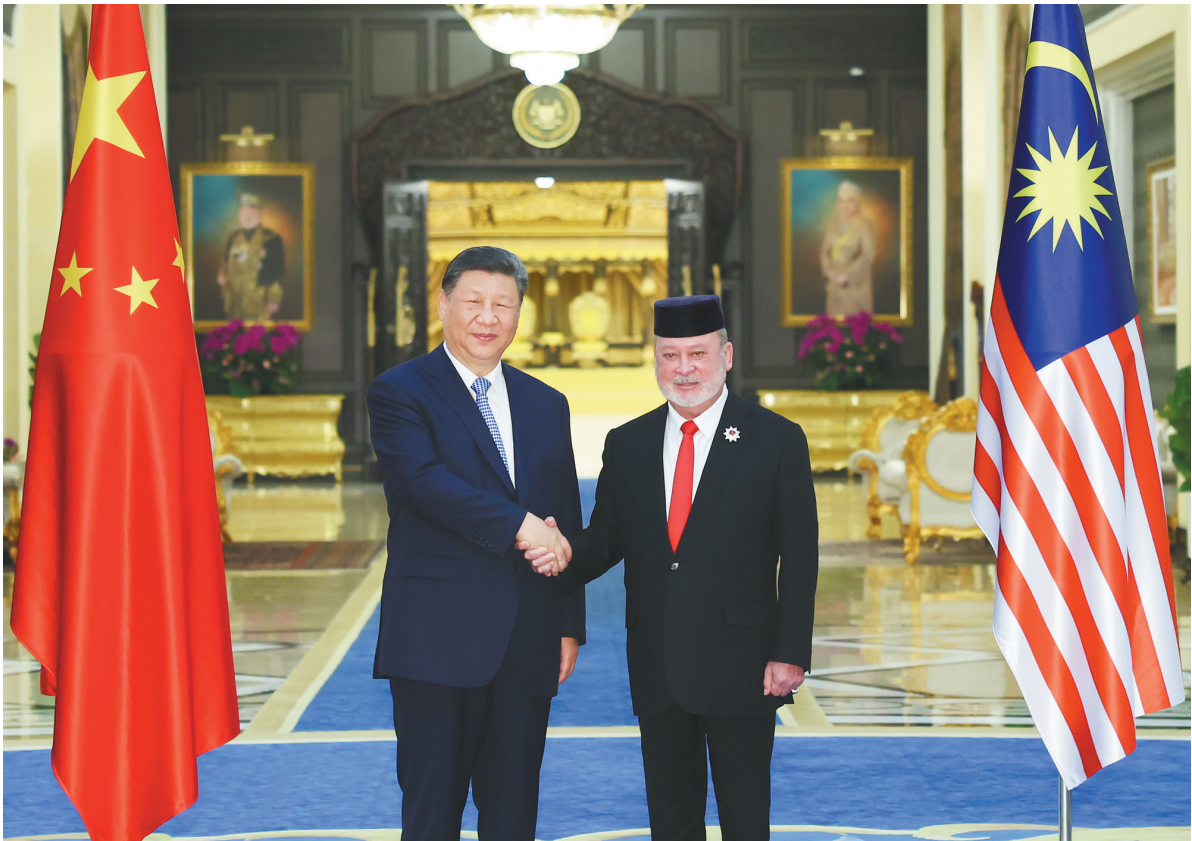
四月十六日上午，马来西亚最高元首易卜拉欣在马来西亚国家王宫同中国国家主席习近平举行会见。

新华社吉隆坡4月16日电（记者杨依军 孙浩）4月16日上午，马来西亚最高元首易卜拉欣在马来西亚国家王宫同中国国家主席习近平举行会见。 4月的吉隆坡，阳光明媚，草木葱茏。 易卜拉欣在国家王宫广场为习近平举行隆重欢迎仪式。 习近平乘车抵达时，易卜拉欣和马来西亚总理安瓦尔在下车处热情迎