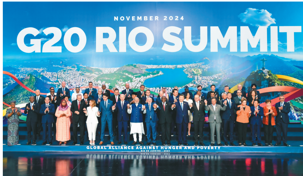
当地时间11月19日中午,国家主席习近平在里约热内卢出席二十国集团领导人第十九次峰会闭幕会议。这是闭幕会议后,习近平同其他与会领导人合影。

新华社里约热内卢11月19日电 当地时间11月19日中午,国家主席习近平在里约热内卢出席二十国集团领导人第十九次峰会闭幕会议。蔡奇、王毅陪同出席。新华社巴西利亚11月19日电 (记者宿亮 陈昊佳)当地时间11月19日下午,国家主席习近平乘专机抵达巴西利亚,开始对巴西进行国事访问。